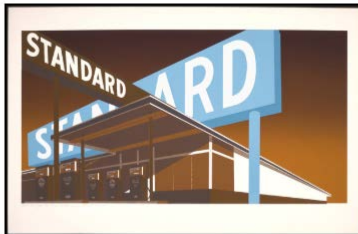
Gambar 2.2 Contoh Gambar 2 (sumber: sebutkan sumber lengkap)

Ed Ruscha mengeksplorasi bahasa dan budaya Pantai Barat Amerika, berpusat pada Hollywood. Mengambil sumbernya dari kehidupan sehari-hari, dengan teknik dan style budaya komersial. Lukisan-lukisannya banyak menyangdingkan antara gambar dan kata-kata yang diambil dari budaya kekinian dalam cara yang evokatif.