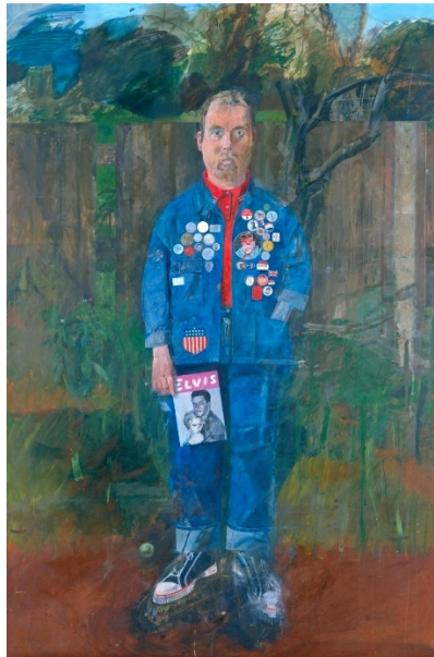
Gambar 2.3 Contoh Gambar 3

menyatakan bahwa seniman Pop Art menggunakan obyek lukis yang “rendahan” dan disajikan dengan biasa saja. Namun dalam realitanya, Pop mengangkat seni ke teriori bahasn subyek yang baru dan mengembangkan cara baru untuk menampilkan subyek-subyek tersebut secara visual. Hal ini adalah manifesto pertama dari postmodernism, atau pergerakan yang menganggap seni sebagai multivalent, diluar batas-batas kategorisasi, dan anti-authoritative.